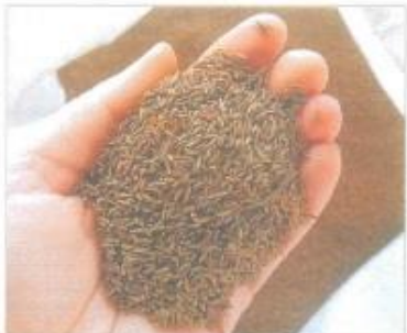
Po mnoha letech, kdy byla ČR jediným vývozcem kmínu, se loni poprvé dostala do výrazného deficitu.