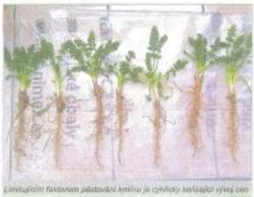
Limitujícím faktorem pěstování kmínu je vyčleňující kolísající vývoj cen.

Herbicidní ochrana kmínu kořenového Bc. Lukáš Bládek ze společnosti Agritec Plant Research. Kmín má jen velmi málo konkurenční schopnosti pro plevely, skládá se proto zejména z registrovaných přípravků na ochranu rostlin (POR) mohou pěstitele kmínu využít Bandur nebo Ke-nolen s účinnou látkou acetofen-díle Butazone 400 (ú. I. MCPB). Landia (ú. I. tembotolone) a Select Super (ú. I. klesbodin). Před zasetením kmínu je důležitá podlitka a aplikace POR