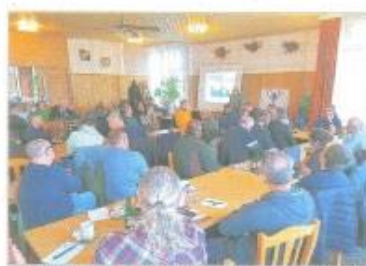
Tradiční seminář spolku Český kmín, z. s., seznamuje účastníky s aktuálními trendy pěstování kmínu v tuzemsku.

roce. „Do loňského roku byl v jedné či dvou polích – kmín ořech a kmín jarní, od letoška přibyla koloska i pro kmín dvoletý,“ doplnil Ing. Linhart. Podle ČSÚ sklízelo kmínu v tuzemsku v roce 2023 dohla jen necelých 1000 tun. Zajímavé je, že na rozdíl od minulých let, kdy podobně nízká sklizeň následovala v ČR vždy po nadprůměrných sklizních v předcházejícím